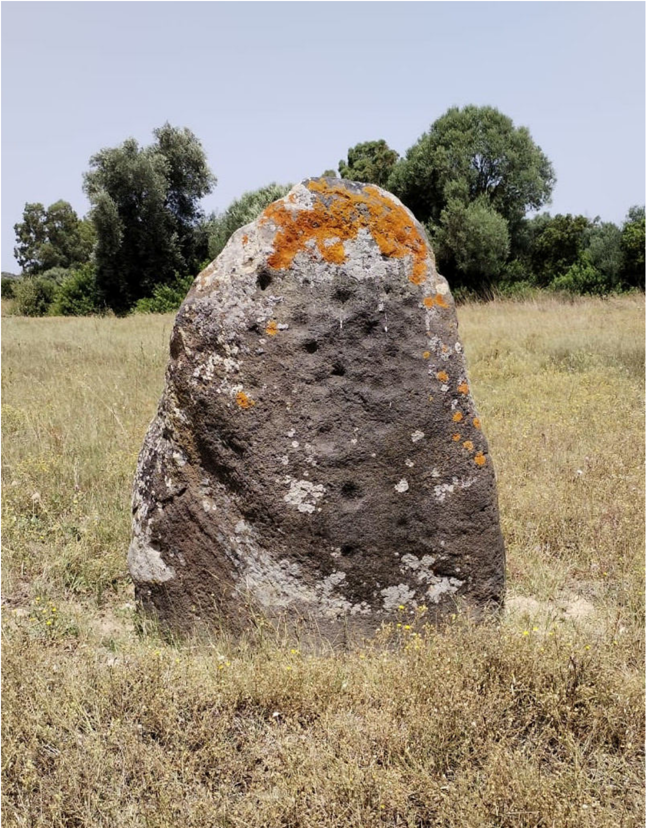
2. Guspini. Menhir in loc. Prunas. Veduta della faccia sud-est