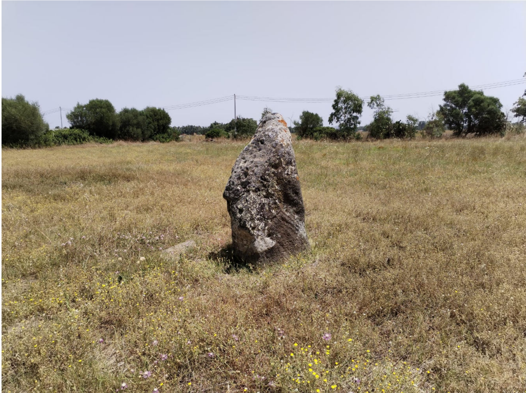
4. Guspini. Menhir in loc. Prunas. Veduta della faccia sud-ovest