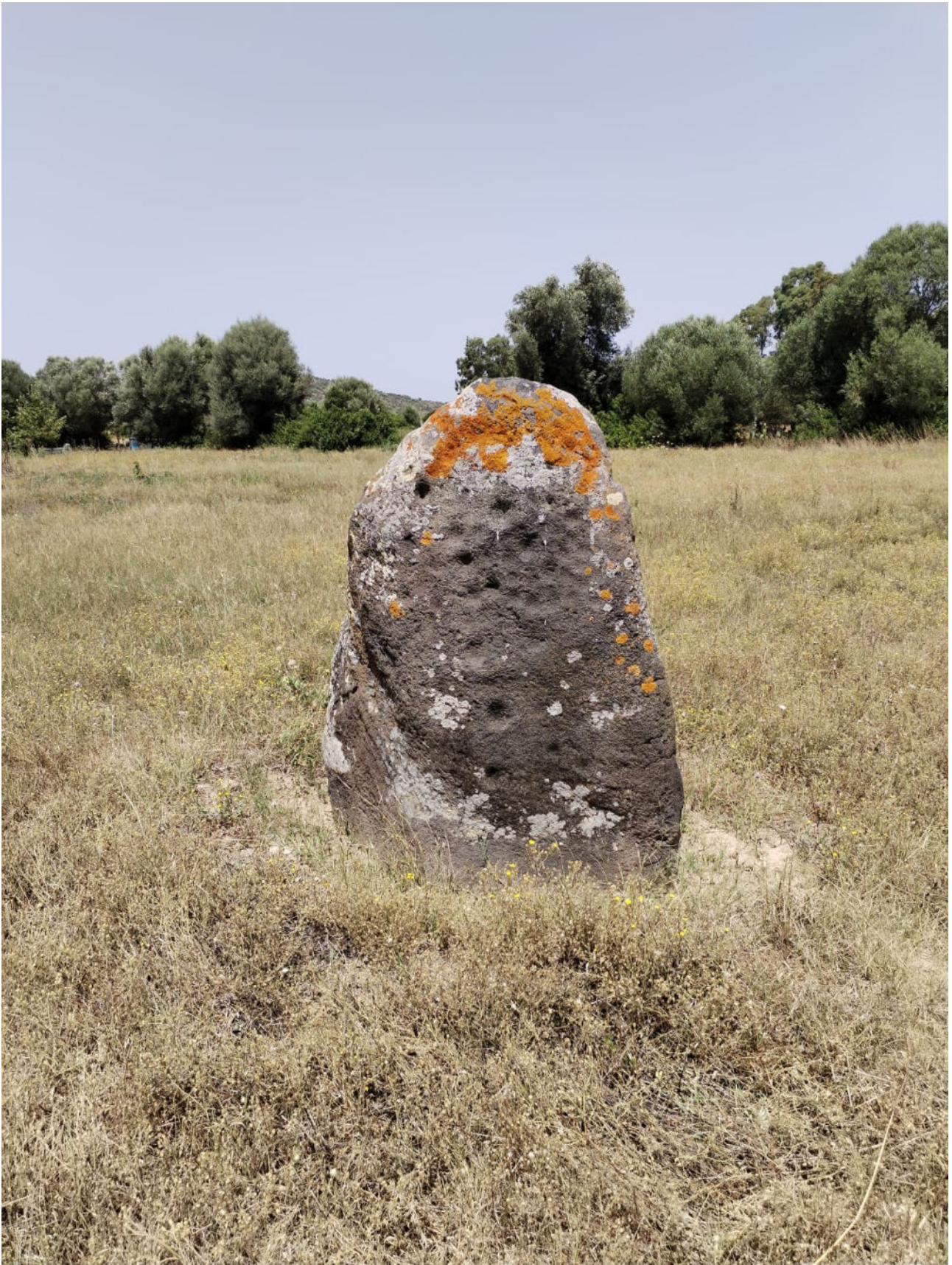
1. Guspini. Menhir in loc. Prunas. Veduta della faccia sud-est