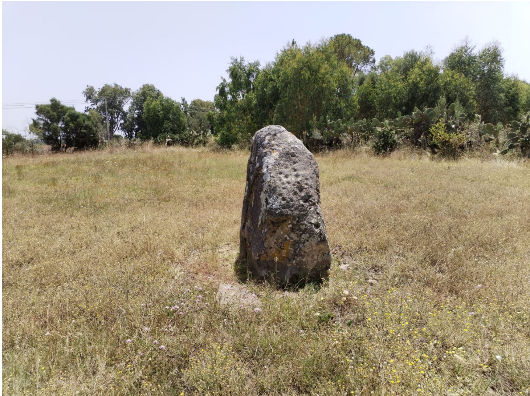
3. Guspini. Menhir in loc. Prunas. Veduta della faccia nord-est