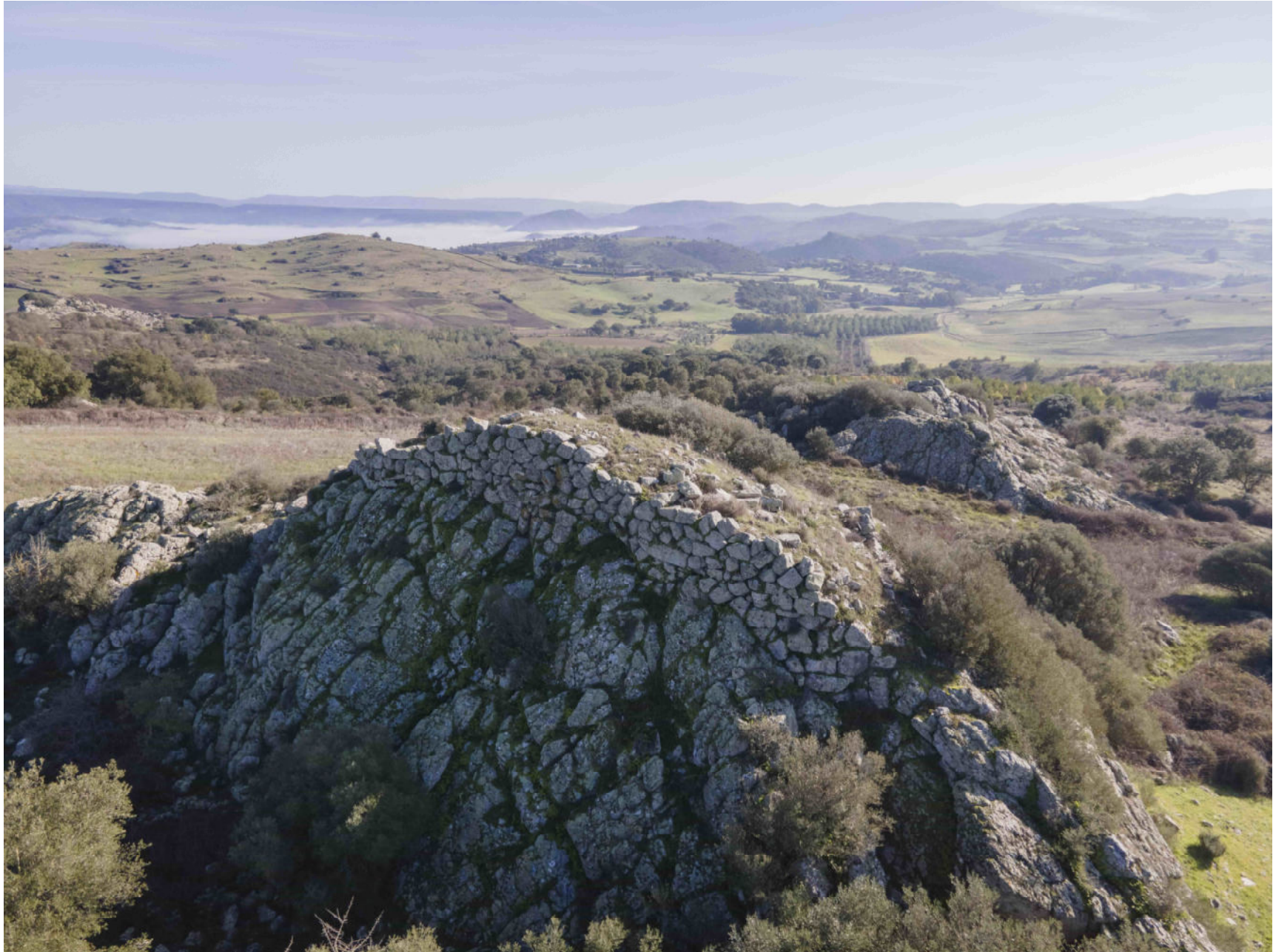
Siurgus Donigala. Nuraghe Corongedda I. Foto 1