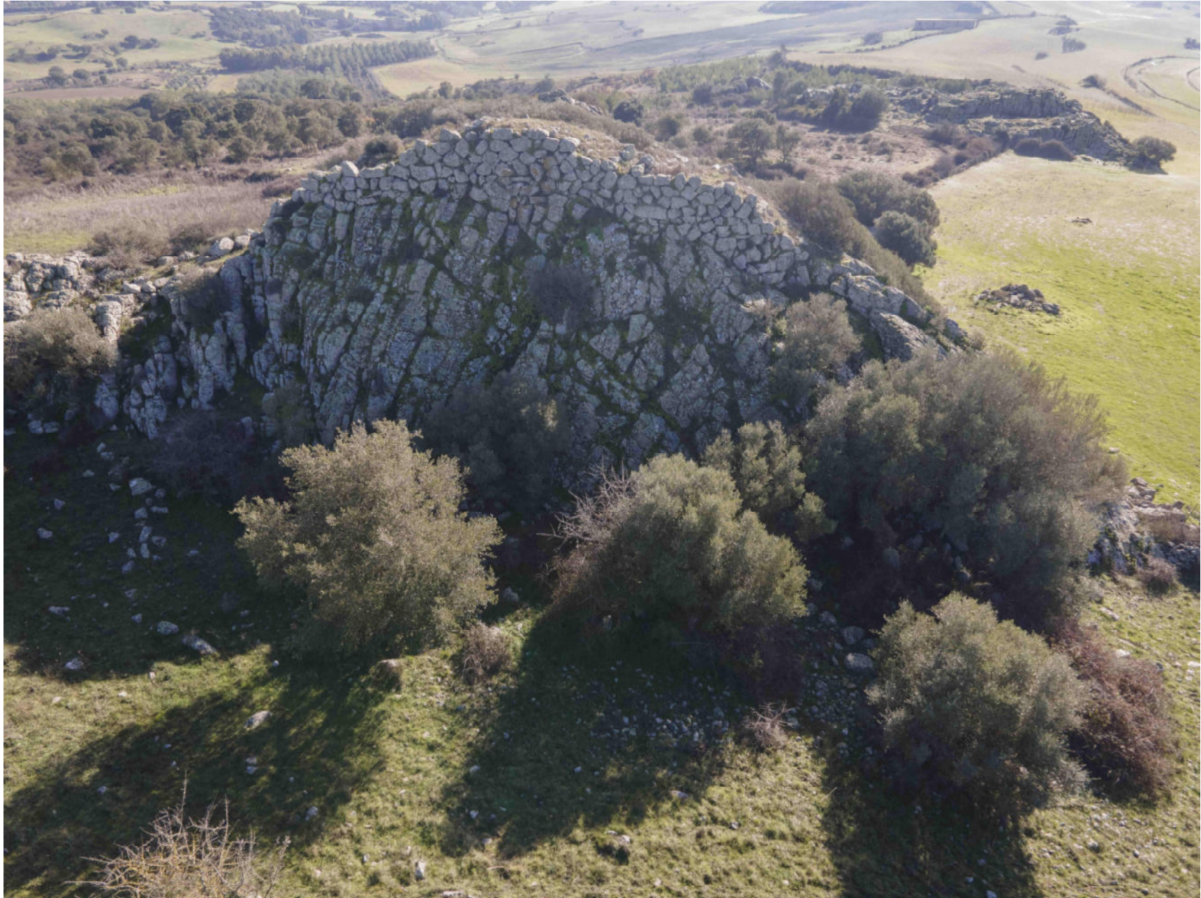
Siurgus Donigala. Nuraghe Corongedda I. Foto 4