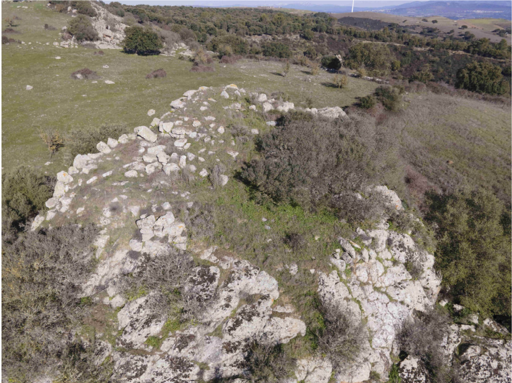
Siurgus Donigala. Nuraghe Corongedda I. Foto 3