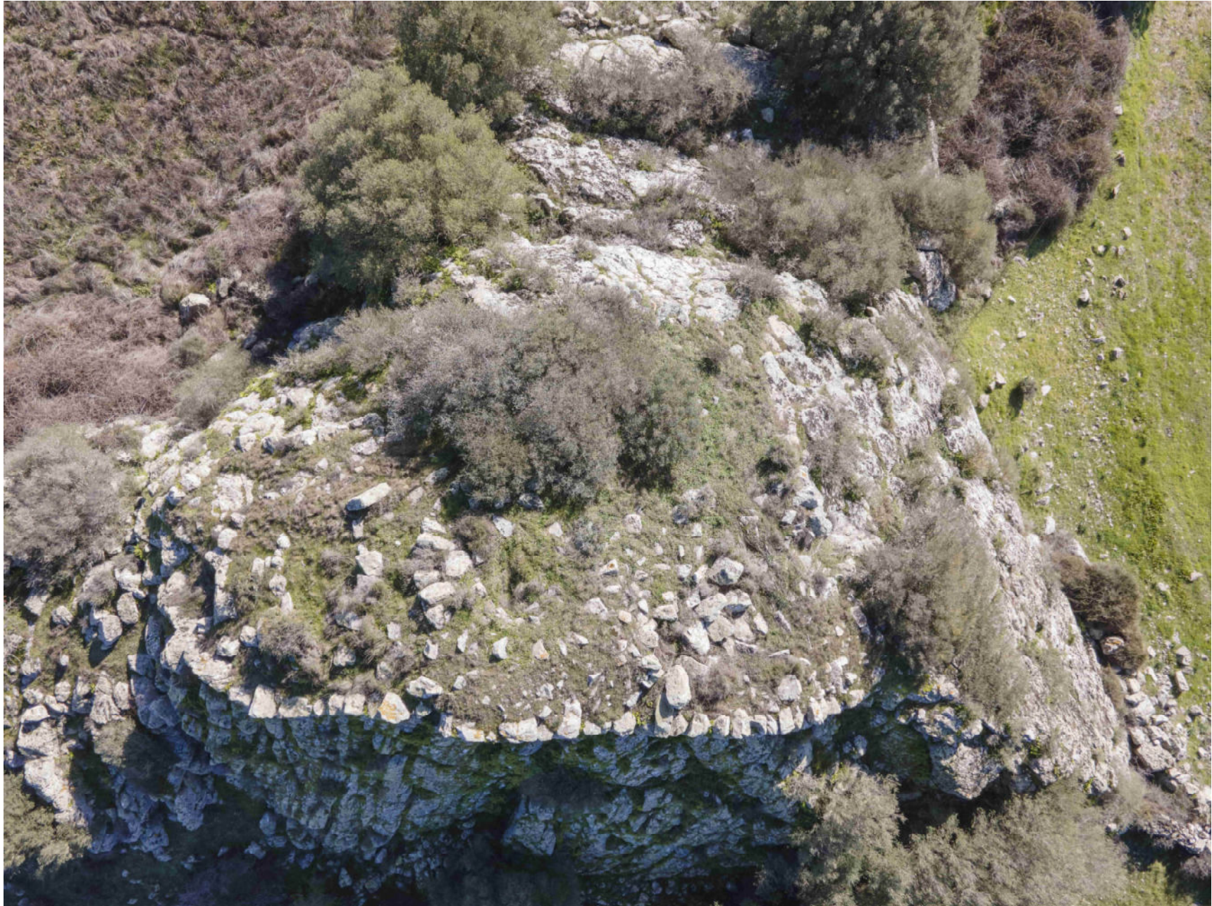
Siurgus Donigala. Nuraghe Corongedda I. Foto 2