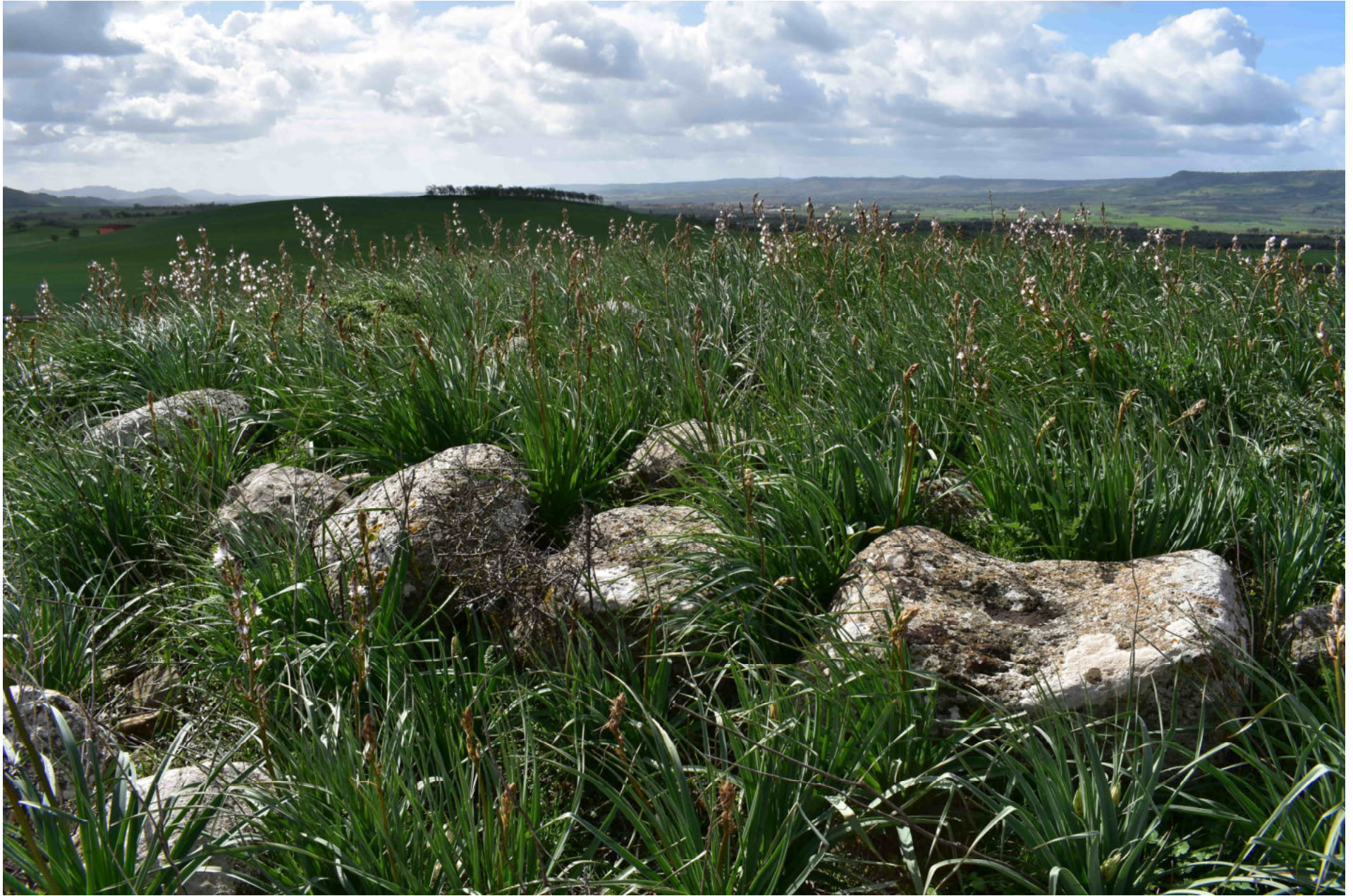
Genuri - Setzu. Nuraghe Furconi Pardu. Foto 2