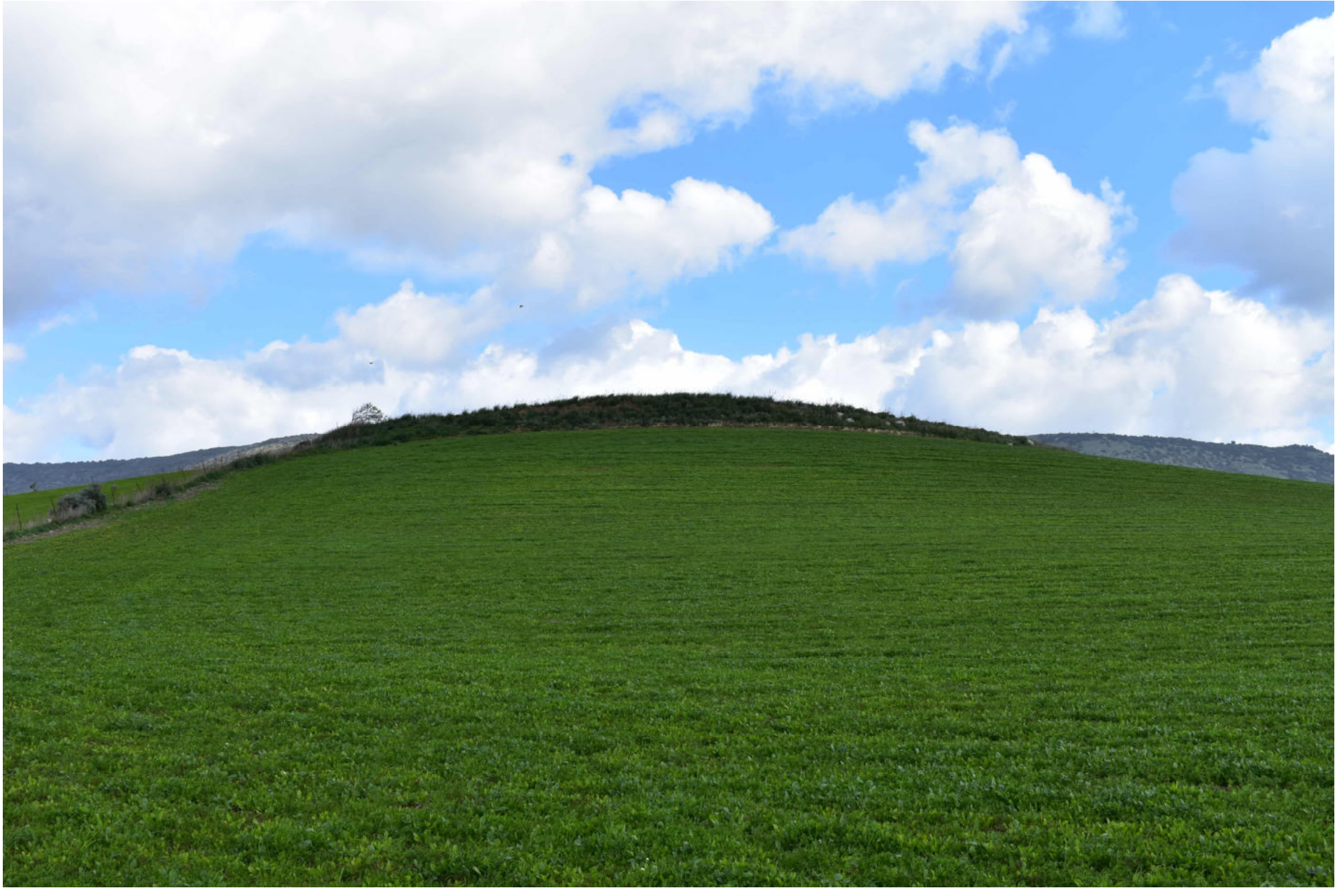
Genuri - Setzu. Nuraghe Furconi Pardu. Foto 1