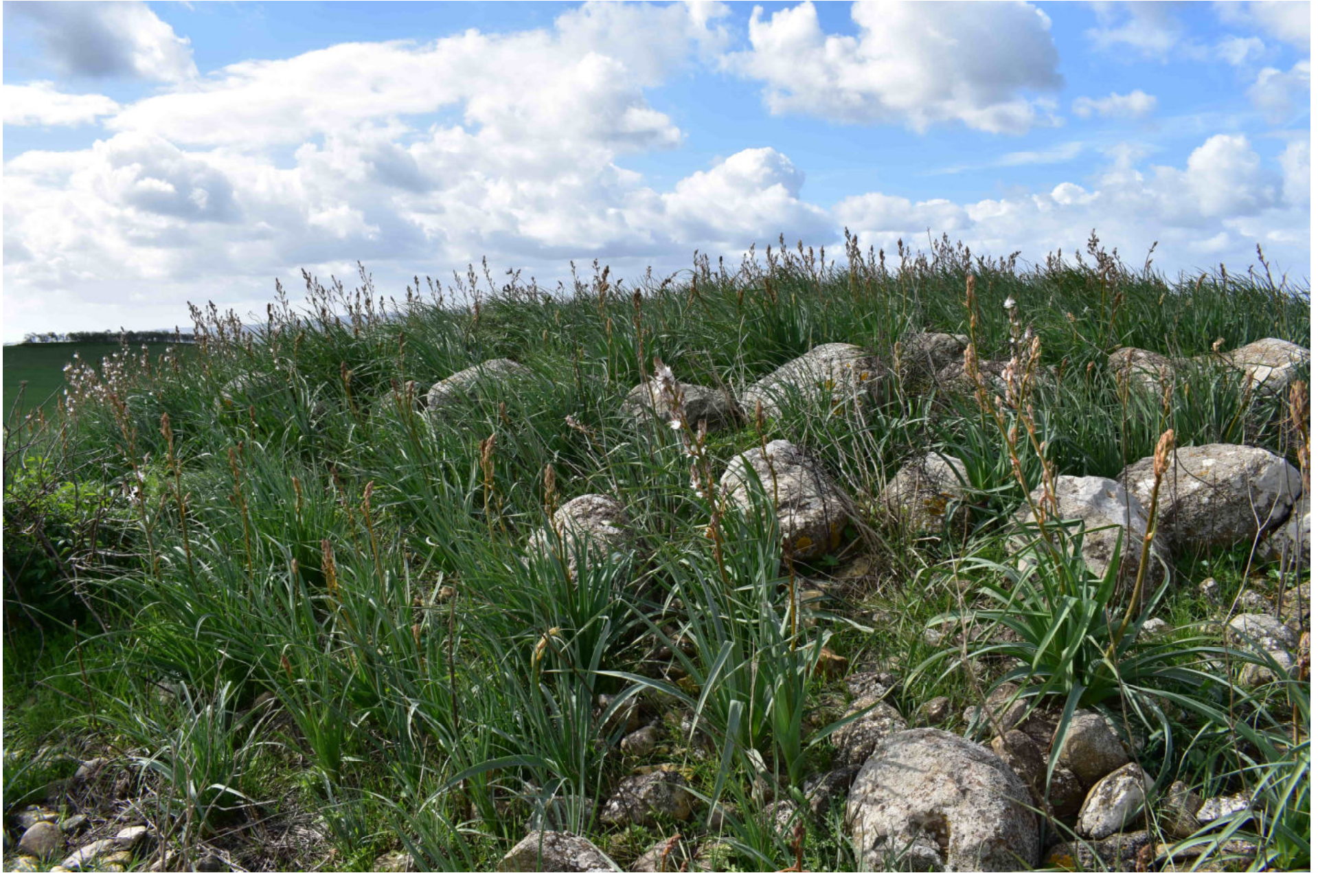
Genuri - Setzu. Nuraghe Furconi Pardu. Foto 3