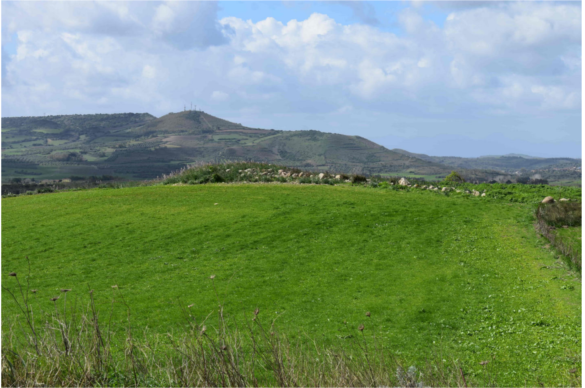
Genuri - Setzu. Nuraghe Furconi Pardu. Foto 5