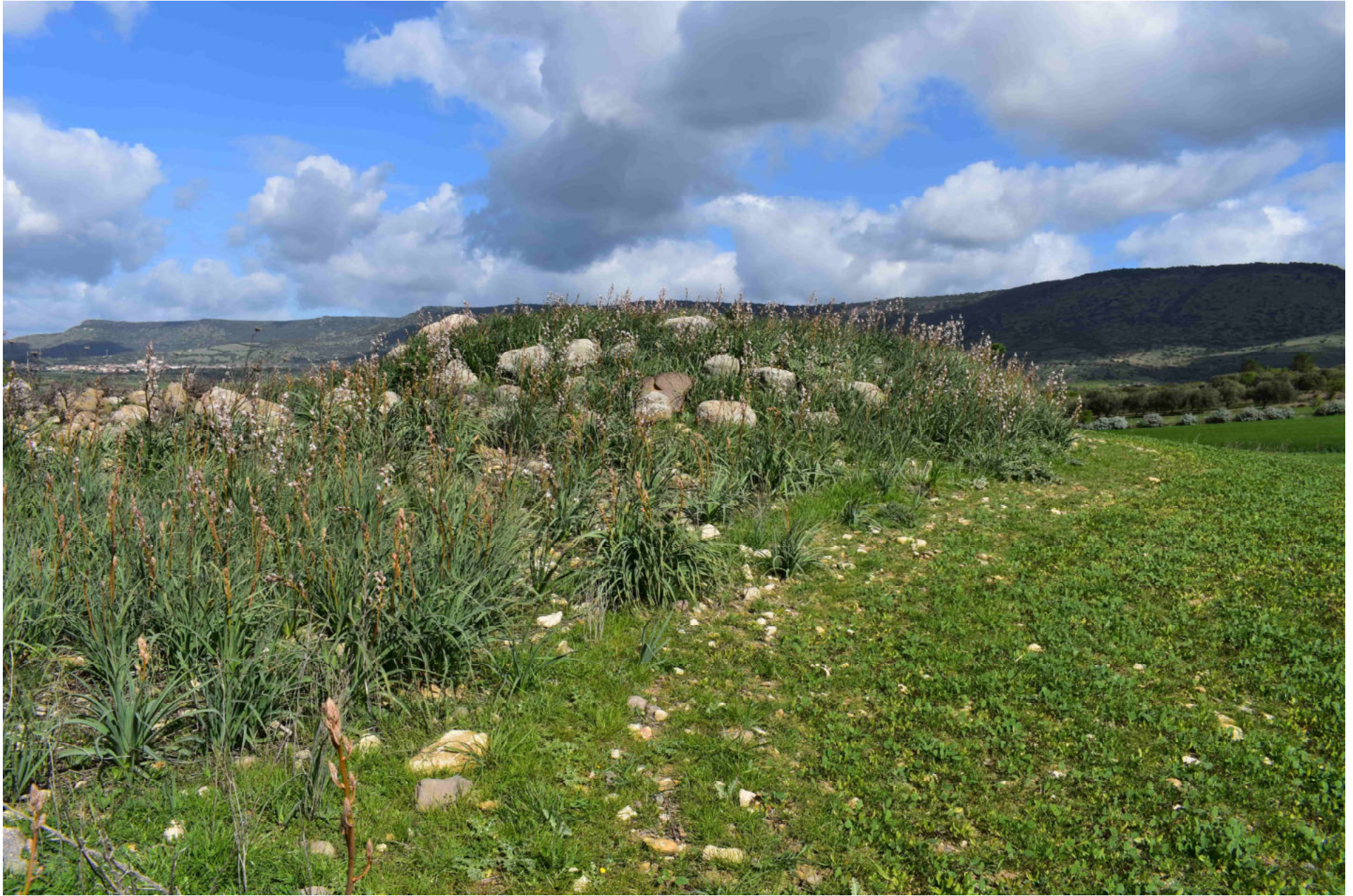
Genuri - Setzu. Nuraghe Furconi Pardu. Foto 4