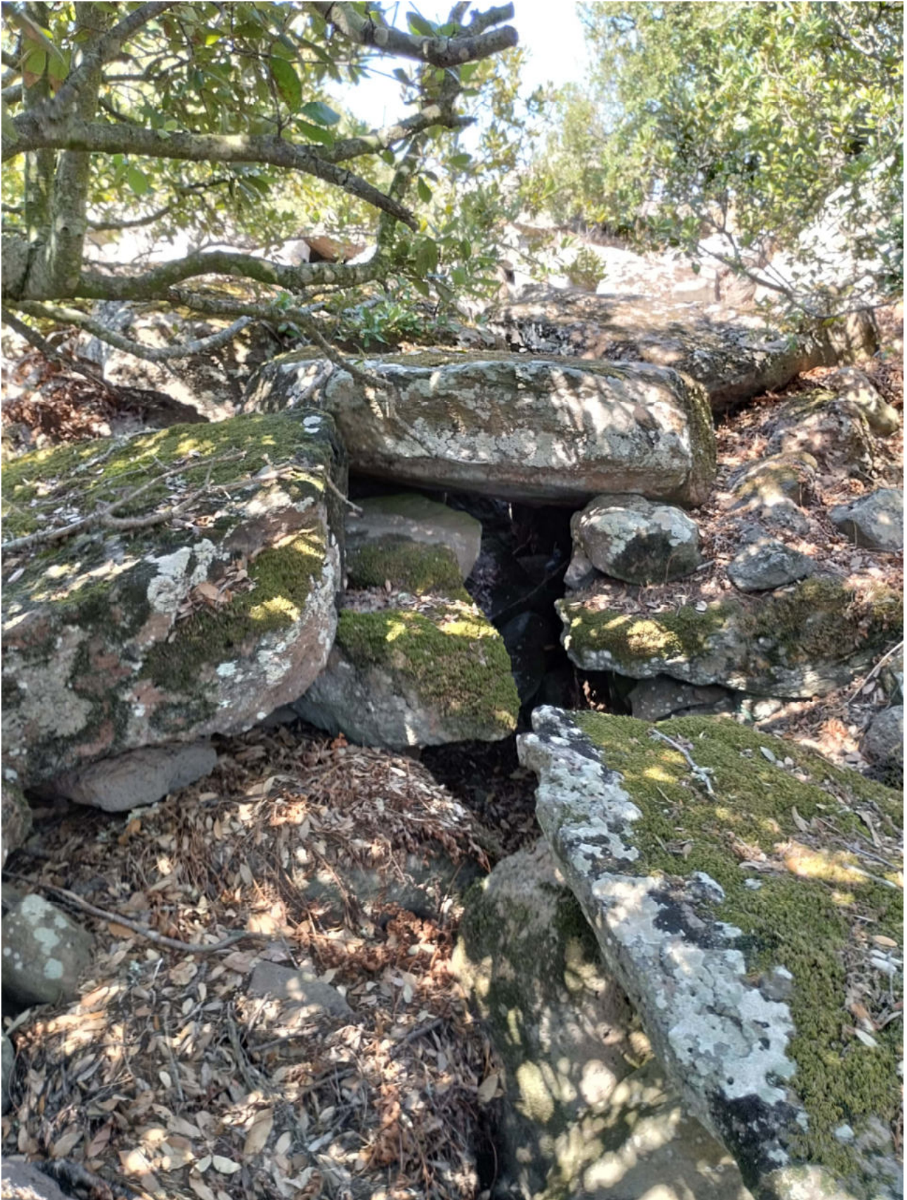
6. Collinas, Siddi. Nuraghe Liccu. Particolare del probabile accesso alla torre