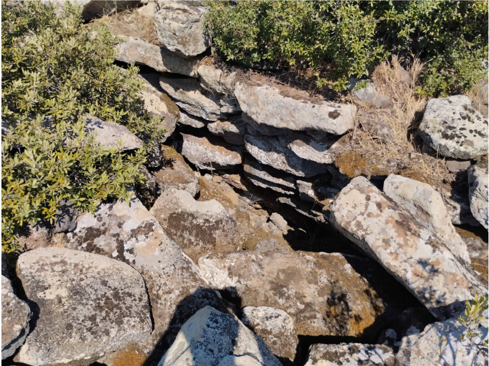
5. Collinas, Sidi. Nuraghe Liccu. Particolare del paramento interno della camera