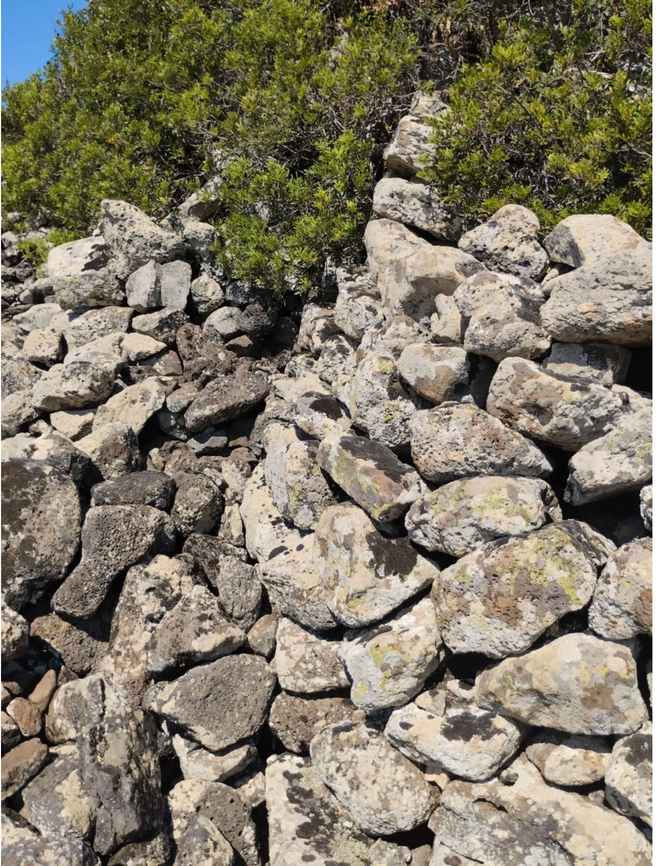
7. Collinas, Sidi. Nuraghe Liccu. Particolare del primo rifascio sud