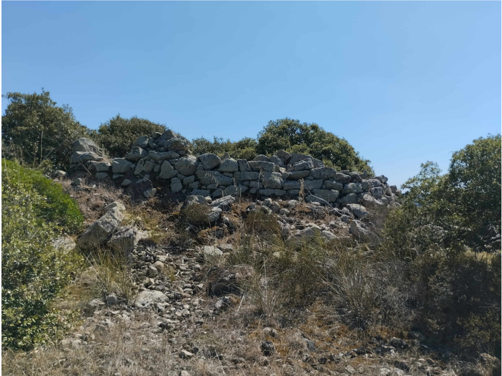
2. Collinas, Siddi. Nuraghe Liccu. Vista da nord del paramento esterno settentrionale del nuraghe