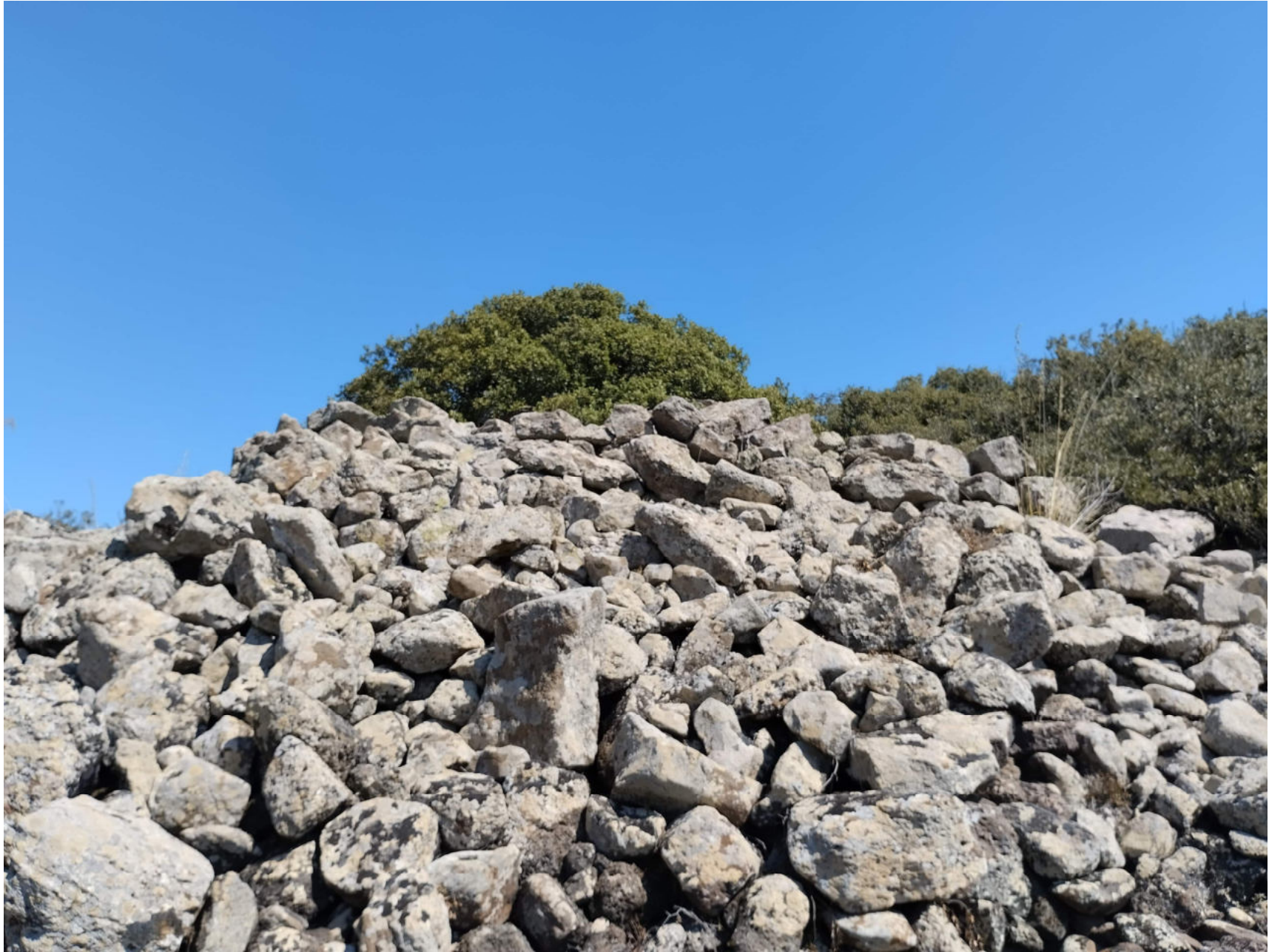
4. Collinas, Siddi. Nuraghe Liccu. Vista da sud-ovest dell'area dei crolli