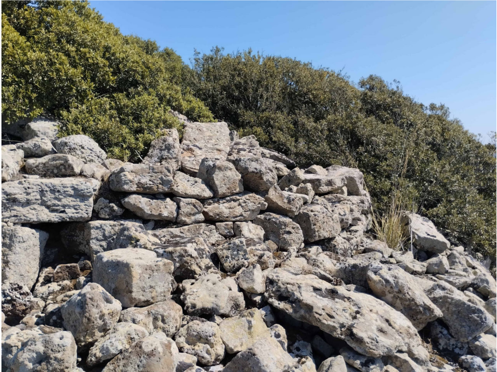
3. Collinas, Sidi. Nuraghe Liccu. Vista da ovest del paramento esterno occidentale