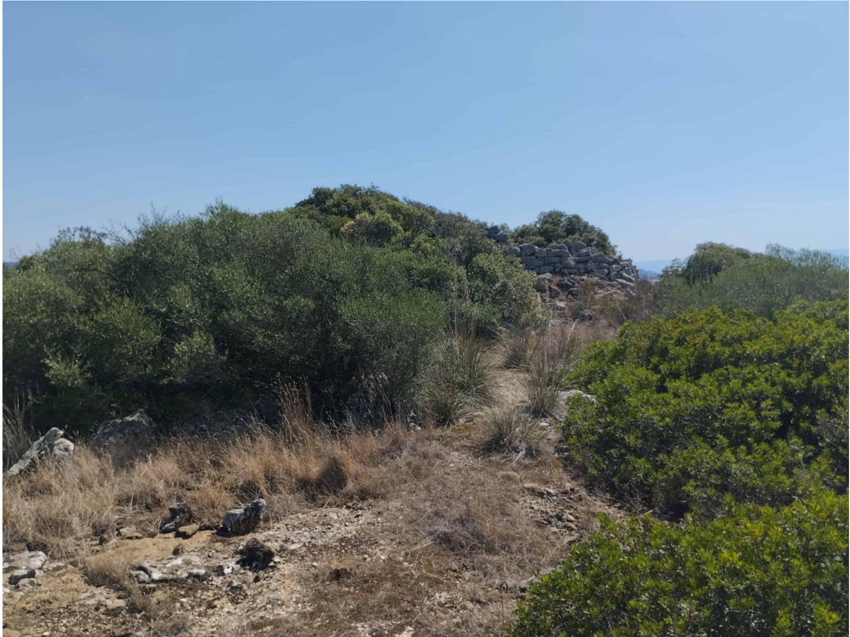
1. Collinas, Siddi. Nuraghe Liccu. Vista del nuraghe da nord