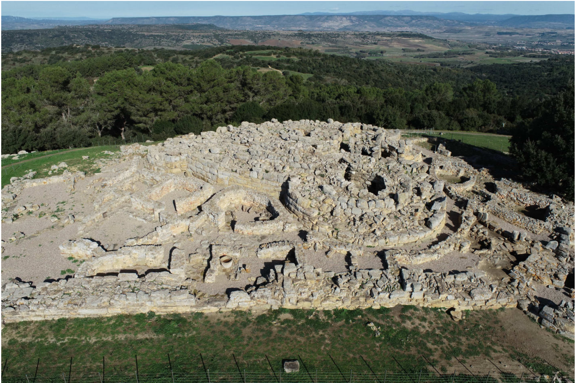
Villanovaforru - Collinas. Nuraghe Genna Maria. Foto 1