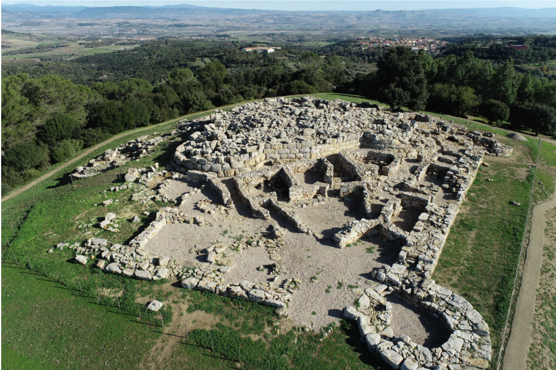
Villanovaforru - Collinas. Nuraghe Genna Maria. Foto 2