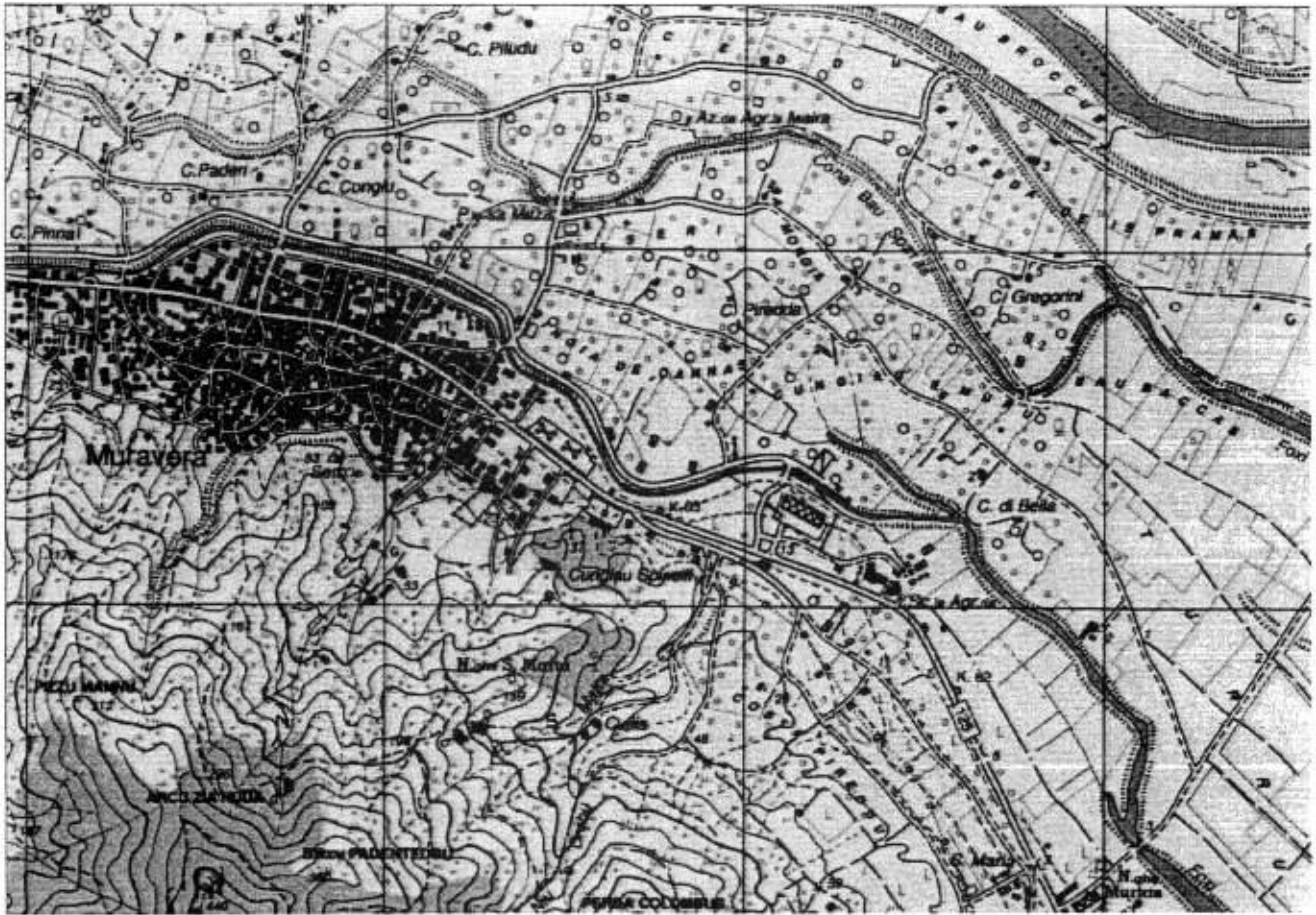
STRALCIO I.G.M. 1: 25.000 FOGLIO 549 S2 MURAVERA