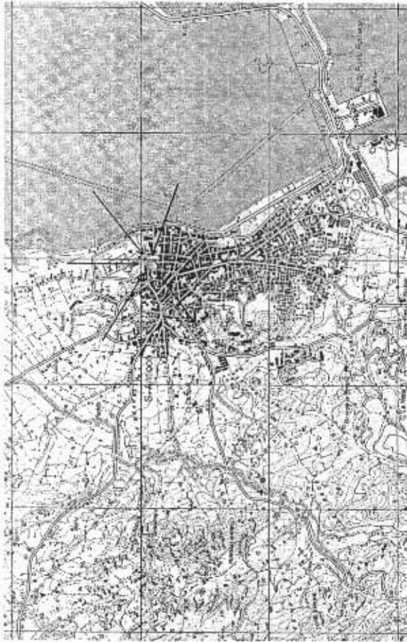
Stralcio cartografia IGM

Sant'Antioco (C.I.) Via Benedetto Croce angolo Via Mazzini Dichiarazione di interesse culturale ai sensi del Titolo I del D.Lgs. 42/2004, e s.m.i. Comunicazione avvio di procedimento ex lege 24/190 e s. m. i., art. 7 comma 1 e 2 e d.lgs. 42/2004 e s.m.i. artt. 8 e 14.