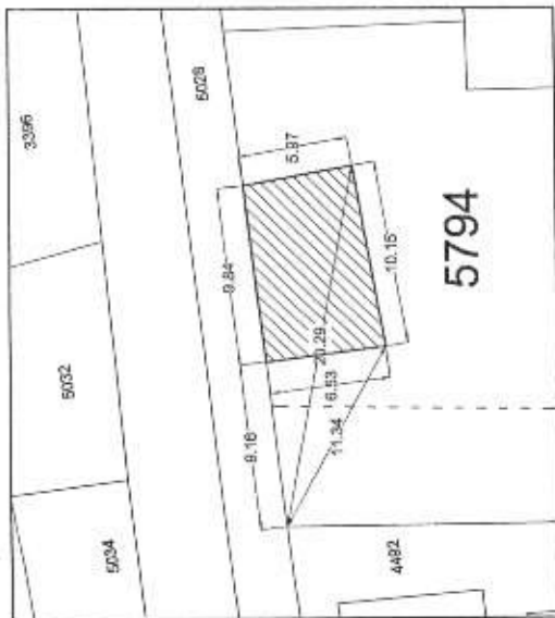
Stralcio dell'area fuori scala

Comune di S. ANTIOCO Planimetria catastale scala 1:2.000