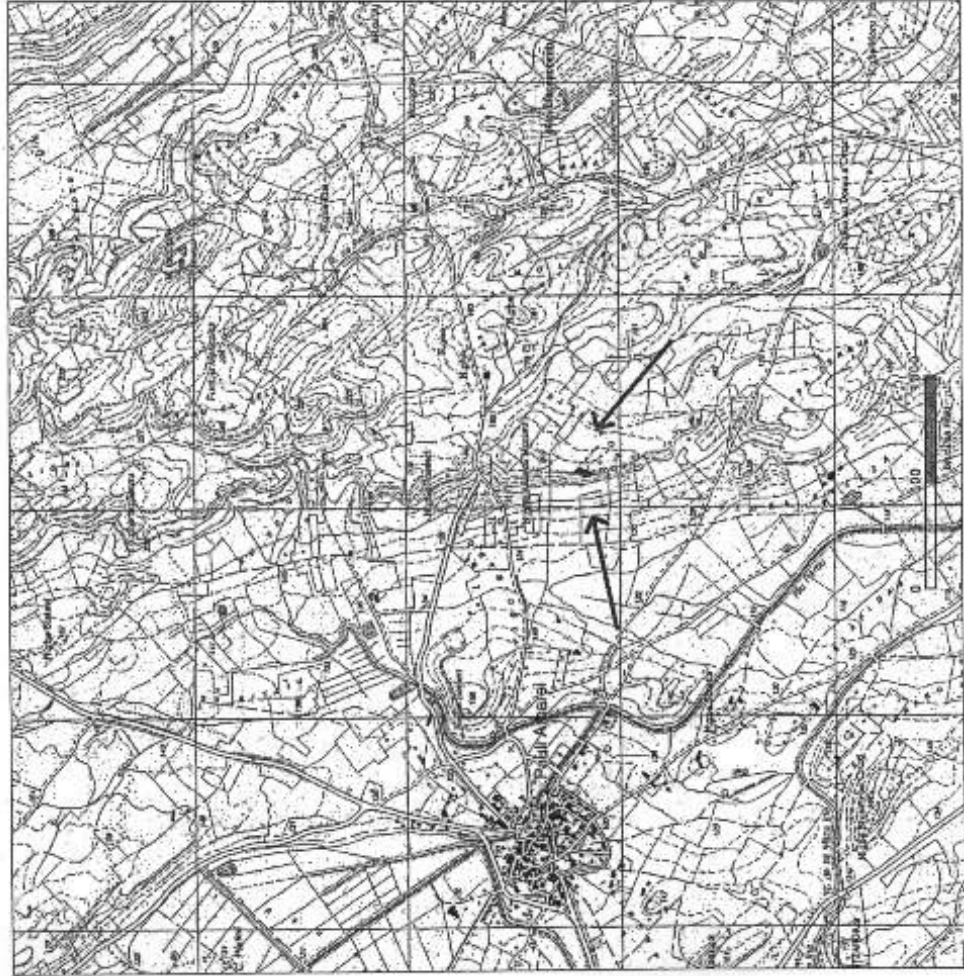
Stralcio cartografia IGM